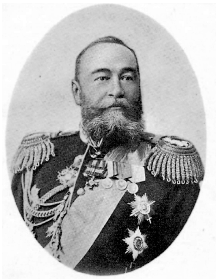
Le Vice-roi Alexeïev

Au bal, outre les officiers de l'armée, de la marine et de l'administration civile locale, il y avait beaucoup de personnes arrivées récemment à Port-Arthur, ainsi que des étrangers du commerce et de l'industrie. Cet automne-là de nombreux fonctionnaires et hommes publics de toutes les provinces d'Extrême-Orient étaient aussi venus. Tout ce public complétait la société habituellement militaire et navale de la région du Kwantung.