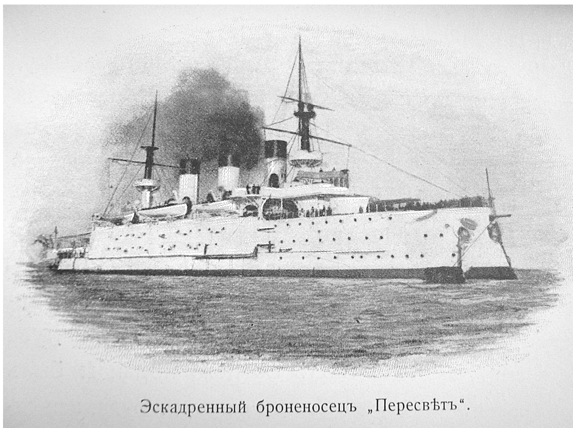
Эскадренный броненосец „Пересвѣтъ“.